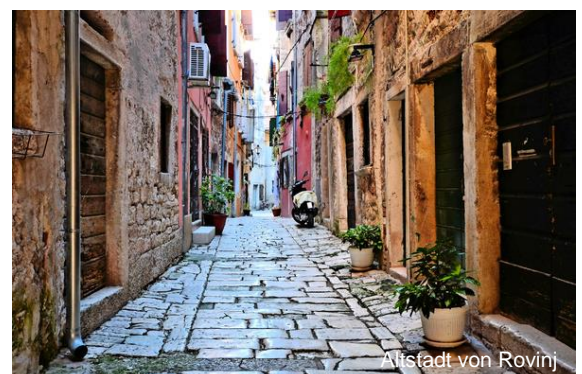
Altstadt von Rovinj

Heute wandeln Sie auf den Spuren der Habsburger im mondänen Seebad Opatija, das zur Zeit der Habsburger im 19. Jh. einen enormen Aufschwung erlebte und ein beliebter Aufenthaltsort von Kaiser Ferdinand und Franz Joseph gewesen ist. Aus dieser Zeit stammen noch viele Bauten, wie die Villa Angiolina, erstes Hotel des Ortes in einem herrlichen Park oberhalb des Yachthafens gelegen. Genießen Sie den Aufenthalt an der Kvarner Bucht.