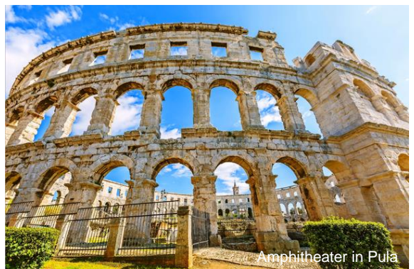
Amphitheater in Pula

Heute besuchen Sie die Stadt Pula, eine römische Gründung, heute größte Stadt Istriens. Aus der Antike stammen das eindrucksvolle Amphitheater, welches zu den sechs größten der Welt zählt, sowie der Tempel der Roma und des Augustus. Nächstes Ziel ist die romantische Hafenstadt Rovinj an der Westküste der Halbinsel. Den schönsten Anblick präsentiert die Stadt jedoch vom Meer aus, wovon Sie sich bei einer Panoramasciffahrt entlang der Halbinsel überzeugen können.